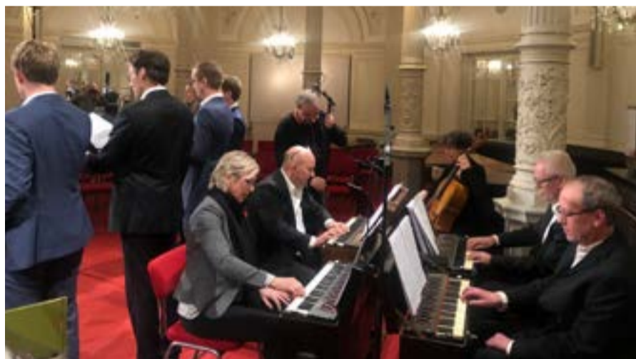
Zondag 24 november 2019 trad DeJongDeJongPlus op in het NPO Radio 4- programma Spiegelzaal in het Concertgebouw te Amsterdam

Dit is nummer 9: het motet BWV 118 , O Jesu Christ, mein's Lebens Licht van Johann Sebastian Bach. De muziek is verwant aan het openingskoor van de Matthäus Passion en de tekst biedt hoop op de verlossing in het licht van de dood. Uitgevoerd wordt het eerste couplet, de video verbeeldt de strekking van de oorspronkelijke 15 coupletten.