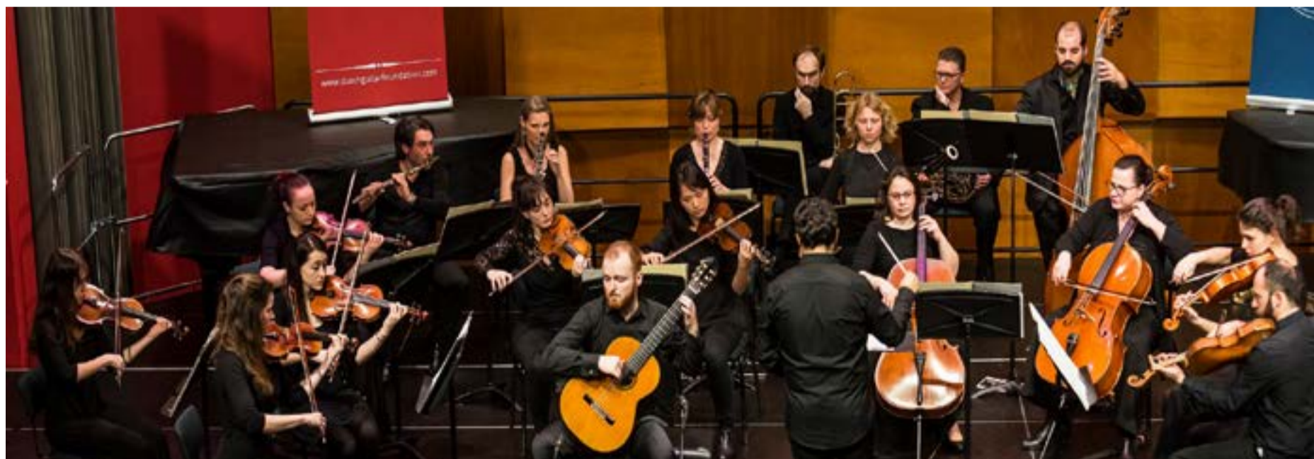
Dutch Guitar Foundation-orkest o.l.v. Dimitris Spouras