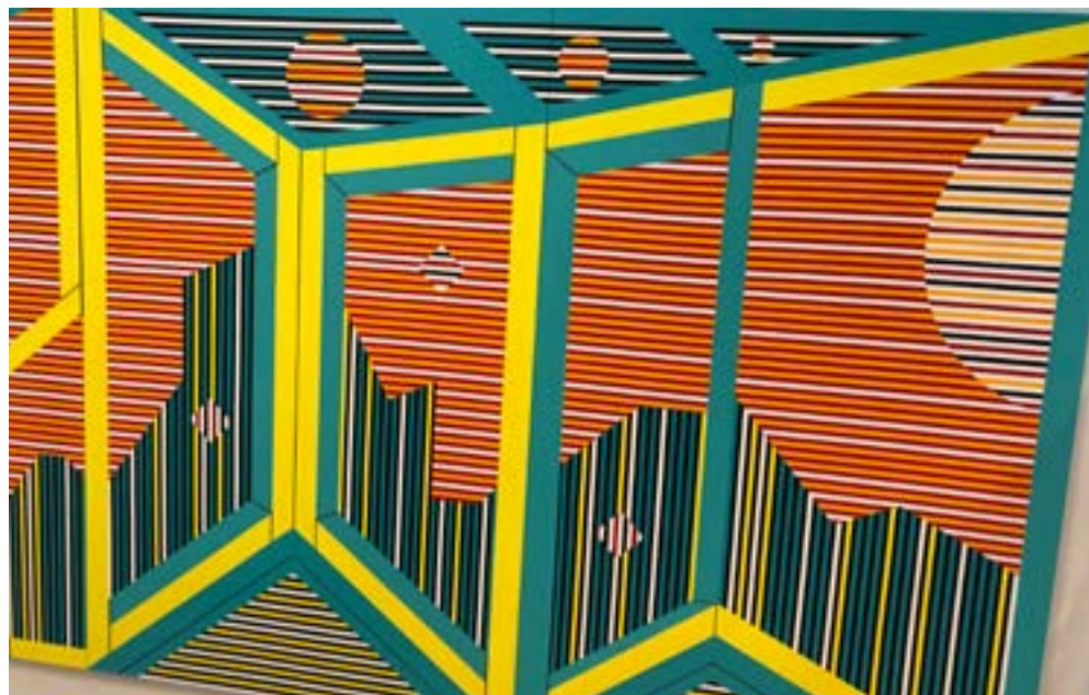
Beyond the horizon, 2019 - acrylic paint on canvas

Eind januari zocht Wia Aalders Sven op in zijn atelier in Vinkhuizen, waar de drie reusachtige canvassen tegen de wand stonden, klaar om ingepakt te worden.