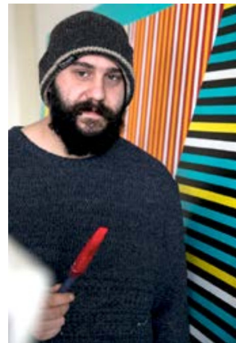
Sven ten Berge © Luuk Steemers

“Het werk hangt op de 4e etage van het conservatorium boven een hele lange trap. En in die trap zit een platform, een soort balkonnetje. En ik dacht hoe mooi zou het zijn als je daar naar een soort landschap kunt kijken. Je komt 's ochtends aan in dit gebouw en 's avonds ga je weer naar huis en je bent de hele dag binnen. Dat gaf me het idee om een zonsopgang of -ondergang te maken. Je kijkt als het ware naar de verte, naar de horizon. Je kunt fantaseren over de horizon, je kent het daar niet, dus je kunt het zo mooi of lelijk, interessant of romantisch maken als je zelf wilt. En het is heel groot, je kunt er als het ware in verdwijnen.”